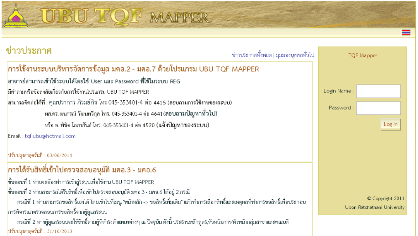
รูปที่ 1 หน้าจอสำหรับการ Login ใช้งาน UBU TQF MAPPER